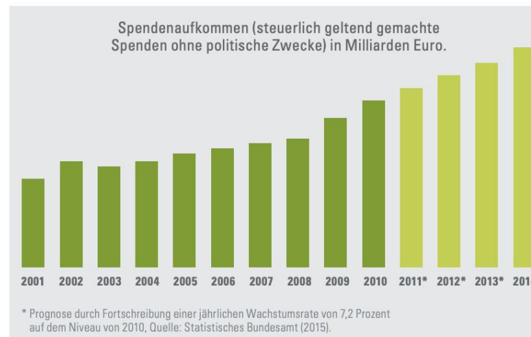
Abbildung 4: Das Spendenvolumen in Deutschland nimmt zu.