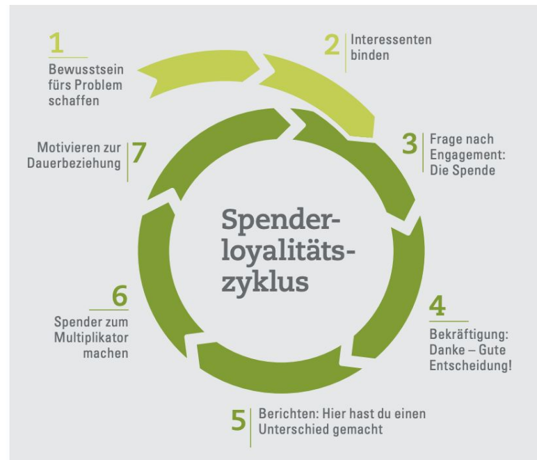
Abbildung 2: Der Spenderloyalitätszyklus stellt die verschiedenen Schritte zur Spendergewinnung und -bindung dar.